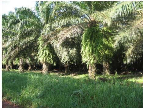
Plantio de palma na empresa Agropalma.

O IBD deu entrada para acreditação como certificador “supply chain” (cadeia de custódia) e em breve estará certificando também nesta modalidade.