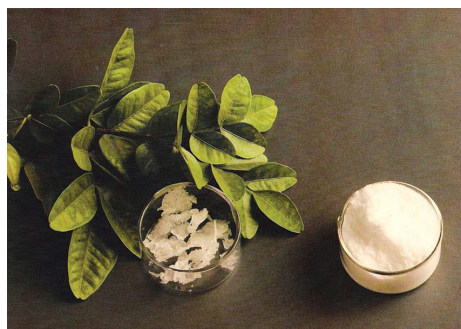
Jaborandi e seu produto, a pilocarpina.

O IBD realizou com sucesso a primeira auditoria UEBT no Grupo Centroflora, inspecionando a VEGEFLOA, unidade localizada em Parnaíba, Piauí. A empresa extrai os sais de pilocarpina do jaborandi, Pilocarpus microphyllus , a única planta nativa que permite tratamento natural de um tipo específico de glaucoma. Essa certificação é importante para o extrativismo desenvolvido pela empresa no Bioma Amazônico seja monitorado de acordo com os critérios de sustentabilidade apresentados na Norma UEBT. A VEGEFLOA extrai esta planta de quatro regiões produtivas no norte do país, em parceria com comunidades locais e com o apoio da GTZ, da Alemanha, no fomento à organização social dos folheiros.