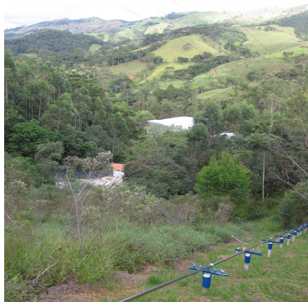
Higident: ambiente protegido na serra.